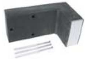
StoFix Trawik F & StoFix Trawik L