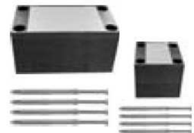
StoFix UMP Q & StoFix UMP R